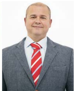
Concejal de Cofradías