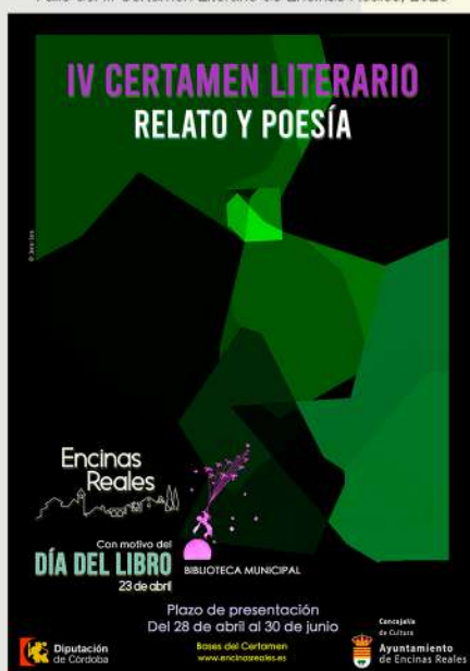
Cartel del IV Certamen Literario de Encinas Reales, 2023

mentiras se alineen, hagan alguna suerte de clic y todo cobre sentido.