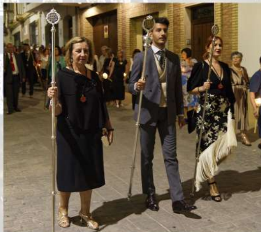
Cofradía del Santo Entierro, María Santísima de la Soledad y la Inmaculada Concepción