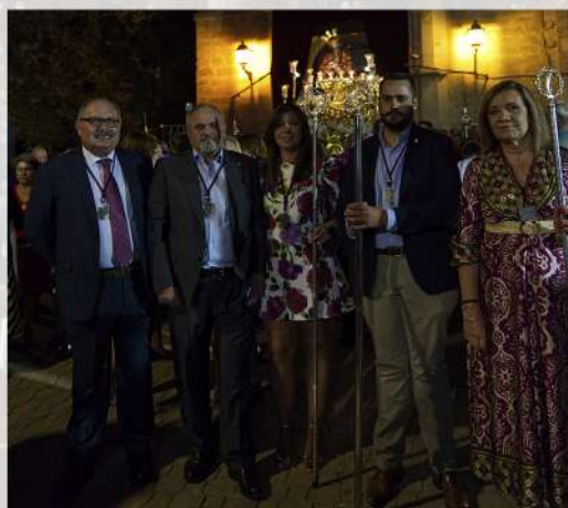
Hermandad de San Juan Evangelista