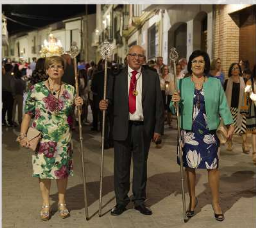
Hermandad de la Virgen de los Dolores