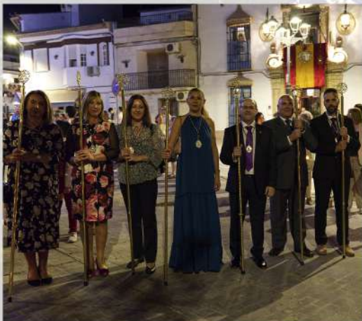
Cofradía de Nuestro. Padre Jesús Nazareno

Este año, especialmente, queremos agradecer su trabajo y apoyo en la obtención de los recursos necesarios para, entre todos, conseguir que se puedan realizar y finalizar, en el menor tiempo posible, las obras de mantenimiento y restauración de la Ermita del Calvario.