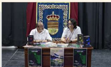
Fallo del III Certamen Literario de Encinas Reales, 2023

Y mentira sobre mentira atravesamos los últimos meses, confiando en que llegue el momento en que todas las